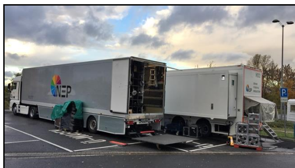
Abbildung Beispiel Ü-Wagen Stellplatz

Für den Fall, dass die benötigten Stellflächen oder Zufahrten am Produktionstag bzw. bei Eintreffen der Übertragungstechnik belegt oder nicht benutzbar sind, hat der Heimverein gegebenenfalls entstehende Mehrkosten (z.B. Abschleppkosten bis hin zum kompletten Produktionsausfall) zu tragen. Dies gilt auch für die benötigten Arbeitsflächen und Arbeitswege im Innenbereich, insbesondere bei kurzfristigen Umbauarbeiten über Nacht.