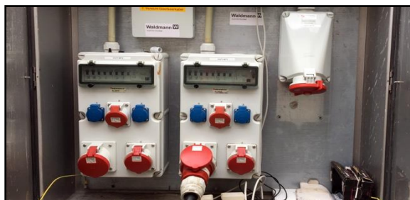
Beispiel Stromanschluss Ü-Wagen Stellplatz