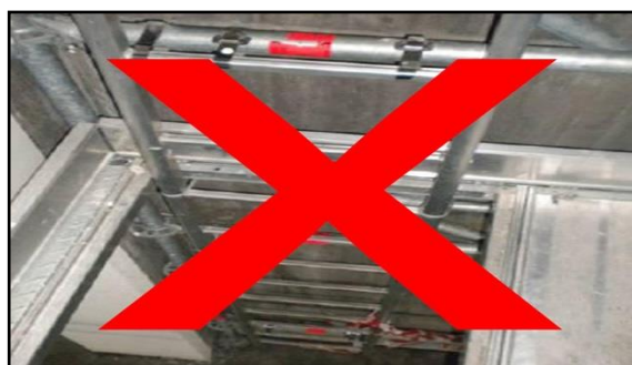
Nicht zulässig: Transport über Steigleiter