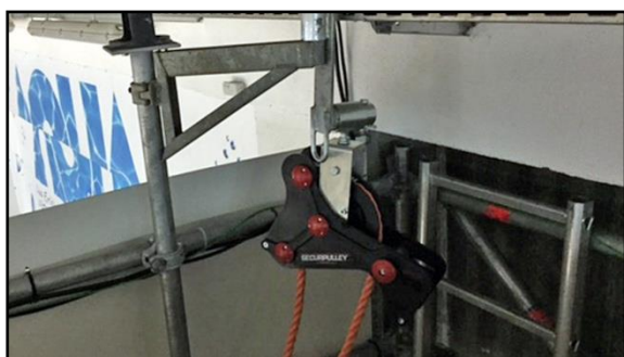
Seilzug bauseits vorhanden

achten, dass auch stehende Zuschauer*innen mit erhobenen Händen die Spielfläche nicht verdecken. Gegebenenfalls ist der Bereich vor der Kameraposition zu sperren und die Zahl der Zuschauer*innen in diesem Bereich zu reduzieren. Dies betrifft auch das Zusammenspiel zwischen den Arbeitsbereichen des Host Broadcasters und der Fotograf*innen am Spielfeldrand. Für Nutzung und Einrichtung aller Positionen sind vom Heimverein bauseits die entsprechenden Voraussetzungen zu schaffen.